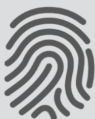
Certificado Digital Notarizado