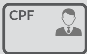
Documento de identificação com foto e CPF