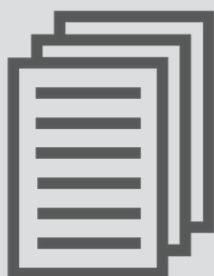
Clique aqui e veja outros documentos necessários