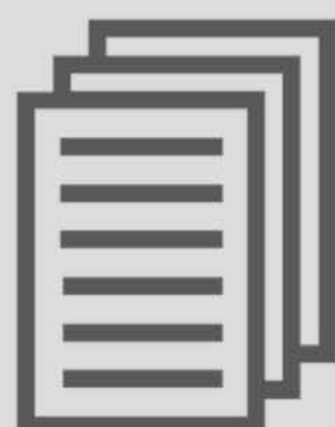
Consulte o tabelião para saber quais documentos adicionar ao requerimento